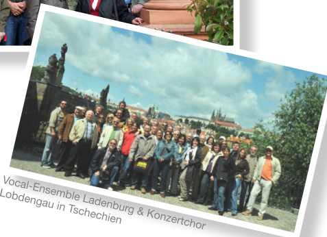
Vocal-Ensemble Ladenburg & Konzertchor Lobdengau in Tschechien