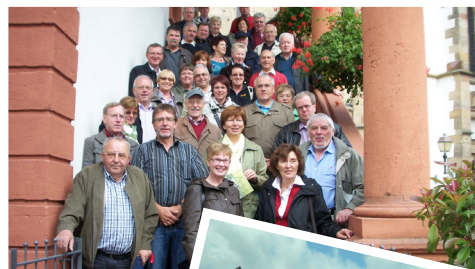
MGV Einigkeit 1914 Werl in Speyer